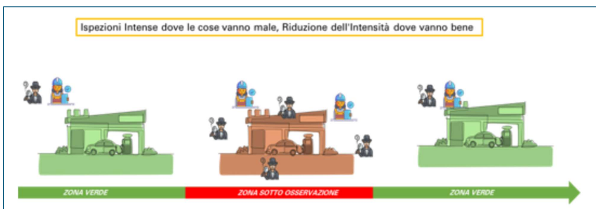
Figura 11-Suddivisione zone per Ispezioni

Di seguito, la figura mostra, in modo sintetico e grafico, la logica sopra riportata.