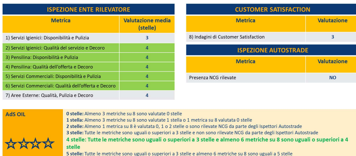
Figura 10-Determinazione punteggio 4 stelle

Osservando la figura sotto riportata, notiamo che per l'AdS Oil presa a riferimento, il punteggio finale è pari a 4 stelle, in quanto, tutte le metriche sono uguali o superiori a 3 stelle e almeno 6 metriche su 8 sono uguali o superiori a 4 stelle.